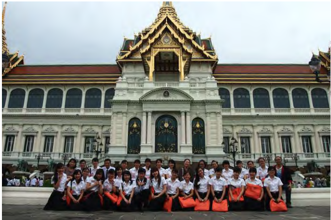
ชมงานศิลป์แผ่นดิน ณ พระที่นั่งอนันตสมาคม